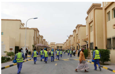
Arbeiders die werken aan de bouw van het voetbalstadion in Al Wakra op weg naar hun kamp.