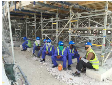
Arbeiders op een bouwplaats langs de snelweg tussen Al Khor en Doha.