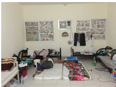
Een slapende man in het kamp Shahaniya.