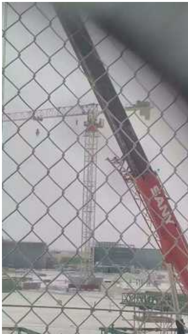
De door een collega genomen foto van de Indiër die zich ophing aan een bouwkraan in Doha.