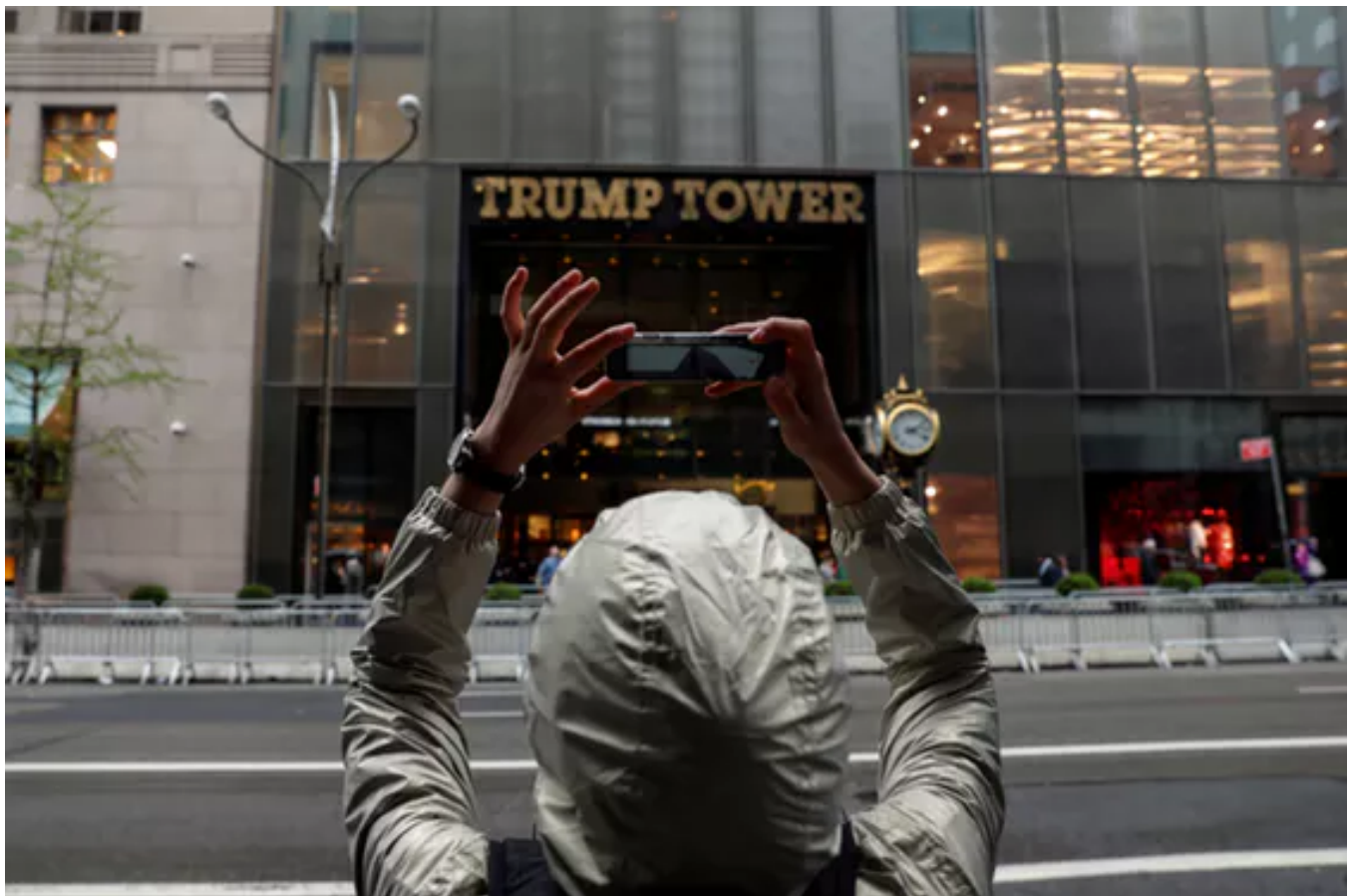
De Trump Tower in New York, waar de twee Nederlandse bv's Bayrock en KazBay uit Amsterdam naar verhuisden.